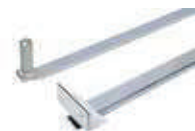
Braccio telescopico standard con accessori per l'installazione 738703